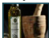
Olio e aceto